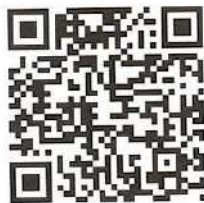
Local Power ホームページ